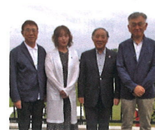
各優勝者 記念写真