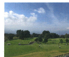
赤城国際カントリークラブ