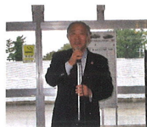
糸井同窓会長のあいさつ